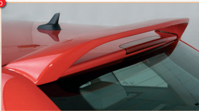
RIEGER Dachflügel, hohe Version