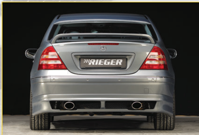
Abbildung mit geändertem Heckansatz für links/rechts Endschalldämpfer