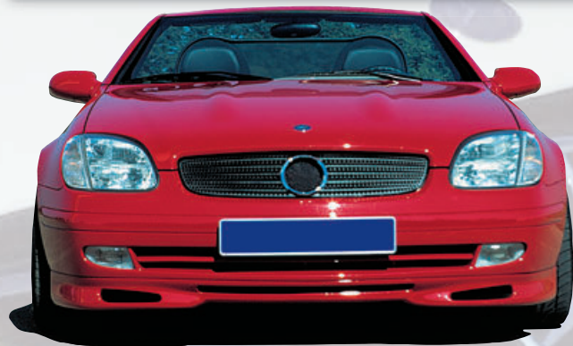
OXIGIN OX 2 FULLCHROME VA+HA 8,0Jx18 ET 35 mit 225/40-18