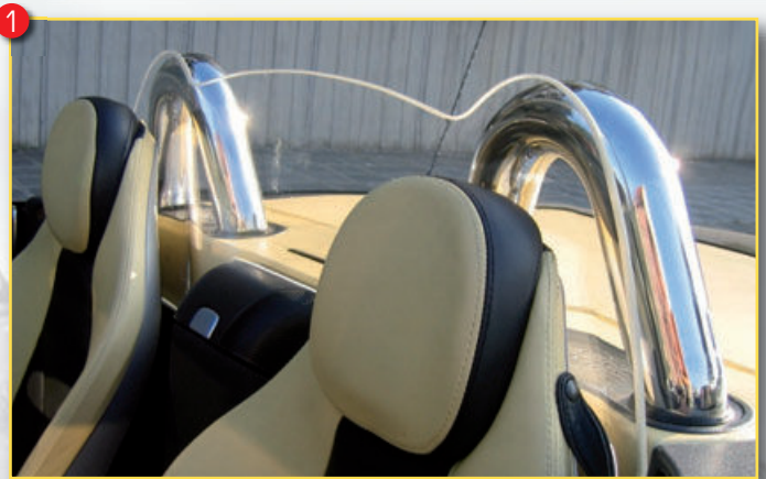
Art.-Nr. Artikel Euro 1 C 00201003 ● Übersrollbügel SLK R171, 2-tlg., 63mm, Edelstahl, poliert 399,00 1 C 00201017 ● Windschott: SLK R171, Montage an Rückwand (Sitzverstellung bleibt erhalten) 249,00