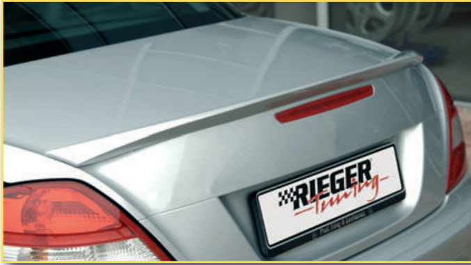
Art.-Nr. Artikel Euro P 00070049 ▲ RIEGER Heckklappenspoiler, SLK R171, PUR 209,00