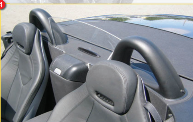
Art.-Nr. Artikel Euro 4 C 00222965 ● Windstop SLK R171, Montage an Rückwand zwischen Originalbügel 149,00