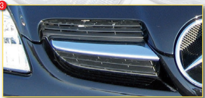
Art.-Nr. Artikel Euro 3 B 00211141 ▲ Kühlerfinnenblenden 2-tlg., Edelstahl poliert, SLK R171, Satzpreis 49,00