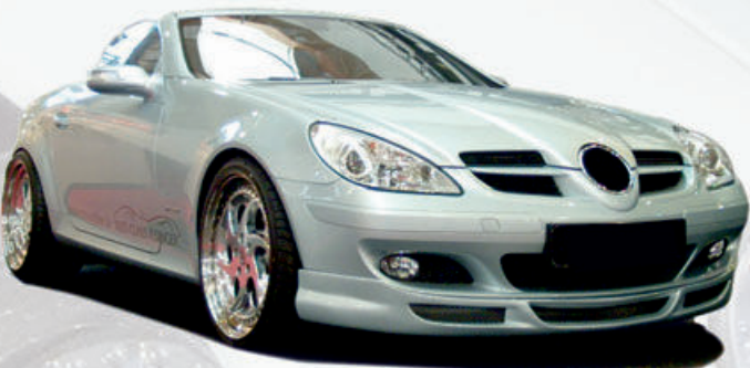
Art.-Nr. Artikel Euro C 00159934 ● Spoilerlippe, SLK R171, inkl. Alugitter, GFK 279,00